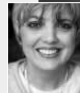
CLAUDIA ROTH, Menschenrechtsbeauftragte der Bundesregierung, hob den Beitrag von REFUGIO zur Menschenrechtsarbeit hervor: