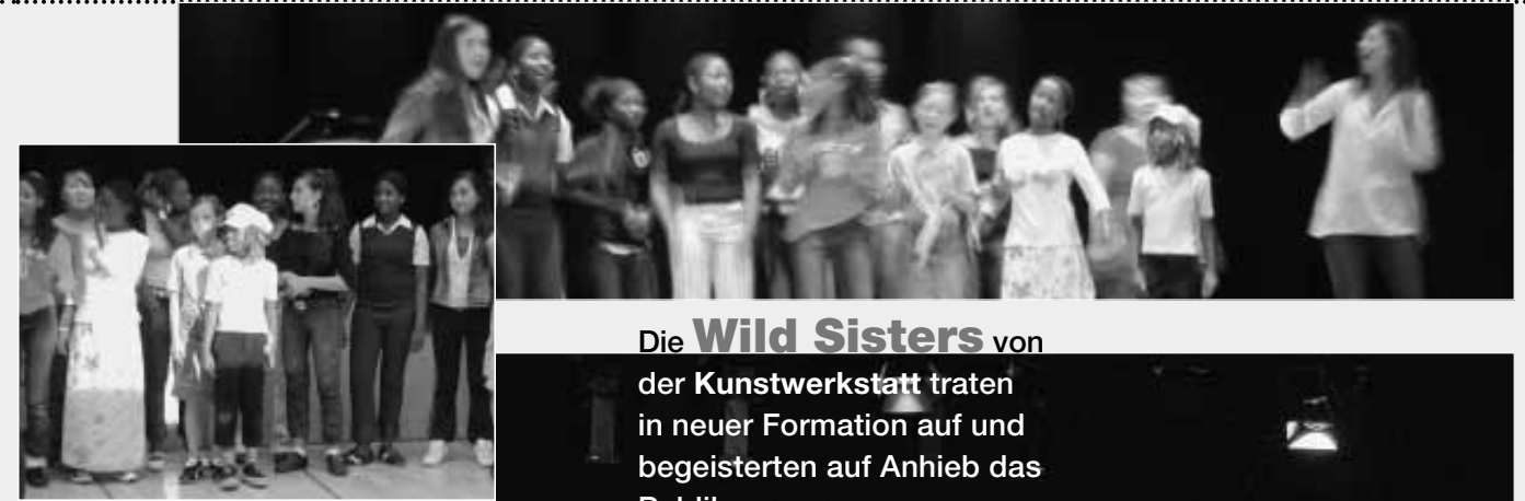
Die Wild Sisters von der Kunstwerkstatt traten in neuer Formation auf und begeisterten auf Anhieb das Publikum.

REFUGIO München ist sicherlich eine der renommiertesten Einrichtungen seiner Art in Europa.