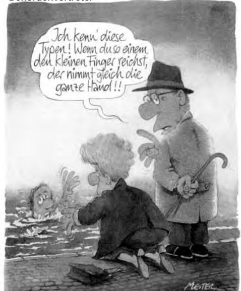
aus „Können Sie sich ausweisen?“ – Karikaturen von G. Mester zu 10 Jahren Pro Asyl, mit freudl. Genehmigung des Künstlers.

wieder Behördenvertretern begegnen, die schauen, wo sie helfen können. Dennoch bleibt ein Wust an Regelungen, vor allem im Rahmen des Asylverfahrens, der den Menschen das Leben schwer durchschaubar macht. ■