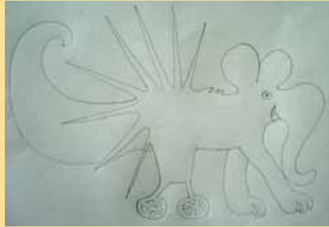
Am Anfang steht die Skizze ▲

Statt gegenseitiger Abwertung untereinander war der Umgang der Gruppe während dieses Projekts äußerst konstruktiv, was sich auch bei der farblichen Gestaltung der Alebrijes zeigte. Die Mädchen malten verschiedene bunte Ornamente auf die Körper und einigten sich bei der Namensgebung auf Max und Lilly. Am Ende des Schuljahres haben sie voller Stolz ihre Figuren durchs Schulhaus und über den Sportplatz getragen und „Gruppenfotos“ mit den fabelhaften Freunden gemacht.