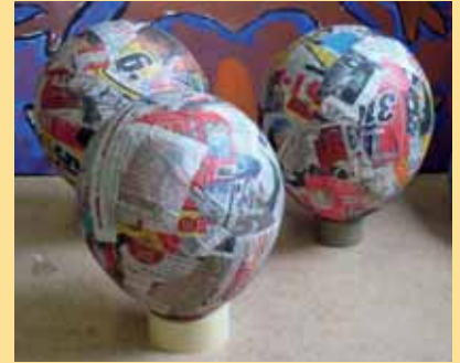
Schritt zwei: der Grundaufbau ▲