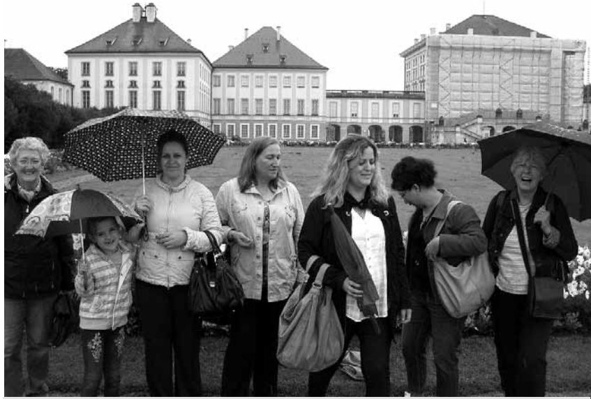
Museumsbesuch „Mensch und Natur“ am Schloss Nymphenburg

Wir drei vom Welcome Projekt haben schon etwas geplant. Z. B. Die Stadtmauerreste um die Altstadt herum zu finden, auf historische Gebäude am Weg hinzuweisen, die Parks mit den Brunnen und Denkmälern, im Winter mehr die Museen. Wir kommen oft nur langsam voran. Vieles ist übrigens auch im teuren München umsonst, z. B. das Hofbräuhaus. Es hat den Ruf, nur touristisch zu sein, aber man muss es doch gesehen haben, oder? Morgens um 10 ist es noch leer und die Kellner zeigen uns gern die alten Wandgemälde, die Krüge der Stammgäste und einiges Interessante – auch wenn wir kein Bier trinken.