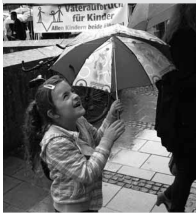
„Platschregen“ beim Treffen am Marienplatz