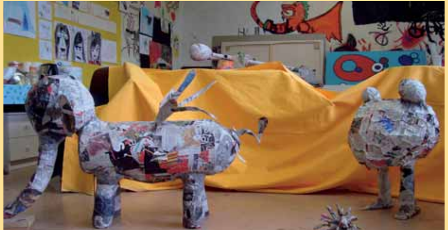
Nun bekommt der Körper seine Form ▲