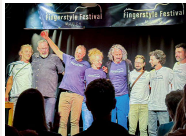
Die Musiker*innen des 1. Münchner Fingerstyle Festivals sammelten Spenden für Refugio München.