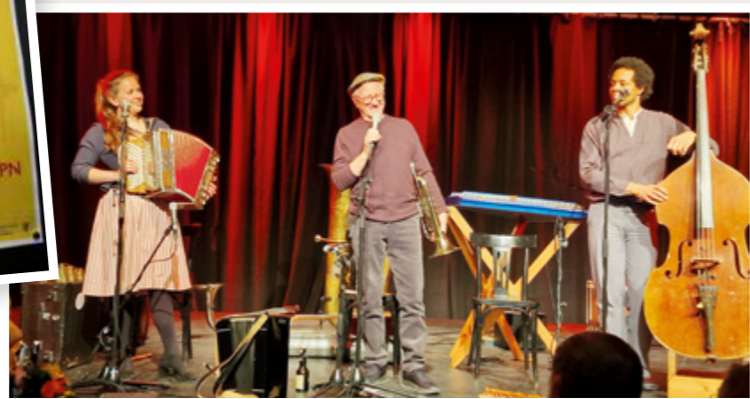
Organisiert von einem kleinen Kreis besonders engagierter Mitglieder des Fördervereins Refugio München, haben die Wellbappn ein Benefizkonzert veranstaltet.