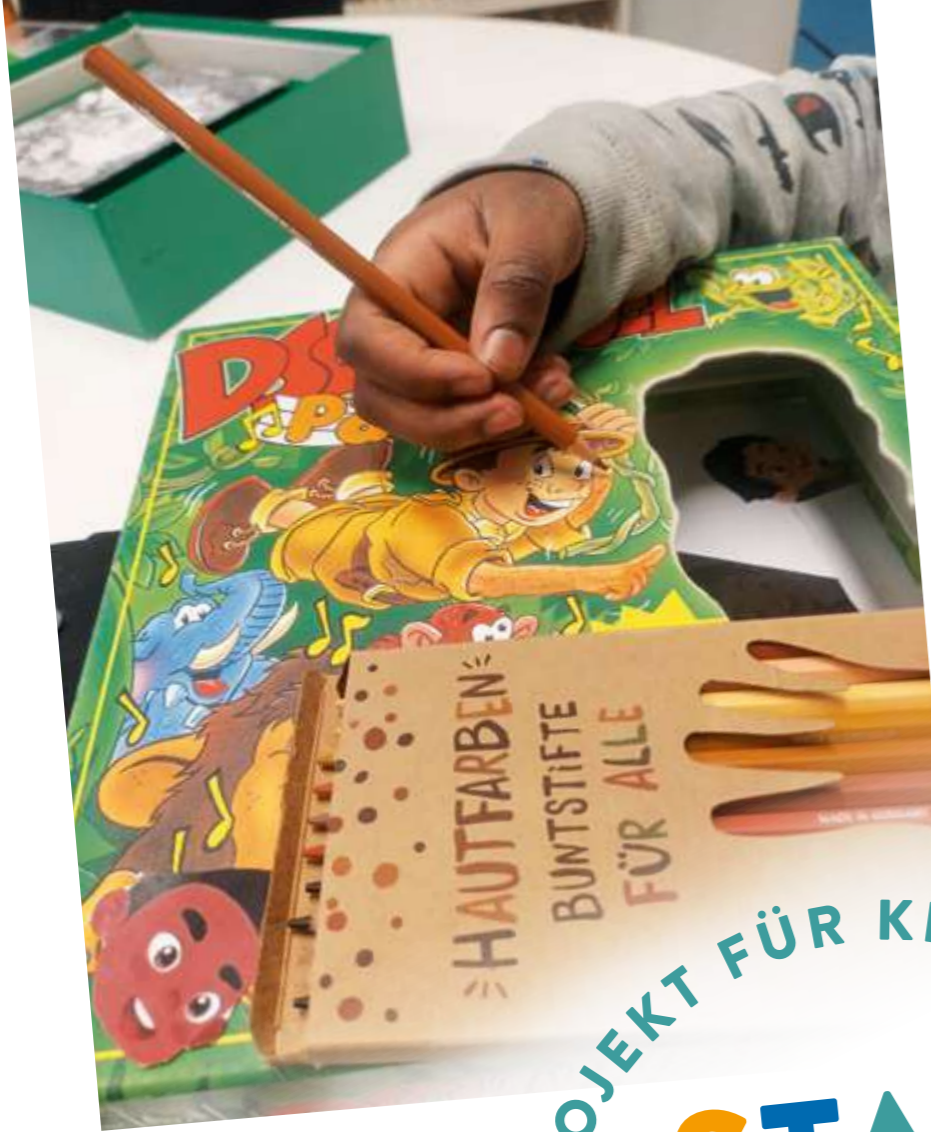
Die Kinder gestalten ein beliebtes Spiel mit Hautfarben für alle um.