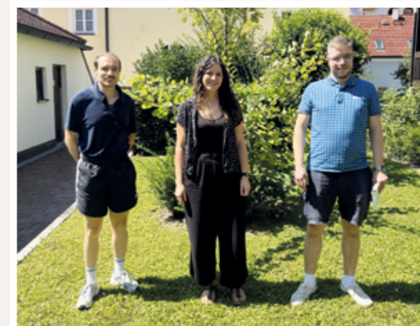
In Landshut organisiert Coppa Antirazzista jedes Jahr ein Fußballturnier zugunsten Refugio München in Landshut.

mit einem Stichwort überweisen – so wird alles eindeutig zugeordnet und wir informieren Sie im Anschluss über das Gesamtergebnis. Selbstverständlich erhalten Spender*innen eine Spendenbescheinigung, wenn sie das möchten. Oder Sie sammeln die Spenden persönlich und überweisen die Summe an unseren Förderverein. Auch hier können wir Spendenquittungen für Ihre Gäste ausstellen, wenn uns die entsprechenden Daten vorliegen.