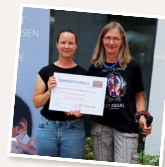
An der Erzbischöflichen Theresia-Gerhardinger-Mädchenrealschule findet jährlich eine Spendenlauf statt. Wenn Sie wissen möchten, wie so ein Spendenlauf funktioniert, kontaktieren Sie uns gerne!

Wir begleiten Sie gerne mit Informationsmaterial, Flyern oder persönlichen Gesprächen bei der Planung. Ob im kleinen Kreis oder mit großer Öffentlichkeit – Ihr Einsatz ist mehrfach wertvoll für unsere Arbeit.